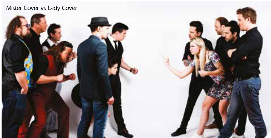
Mister Cover vs Lady Cover

Nous aurons encore l'occasion cette année d'insuffler un vent nouveau en vous offrant deux scènes pour toujours plus de spectacle, sans interruption ! Mais les festivités de la Fête nationale conserveront bien leur leitmotiv - un savant mélange d'artistes locaux et d'artistes nationaux professionnels !