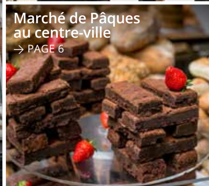
Marché de Pâques au centre-ville → PAGE 6