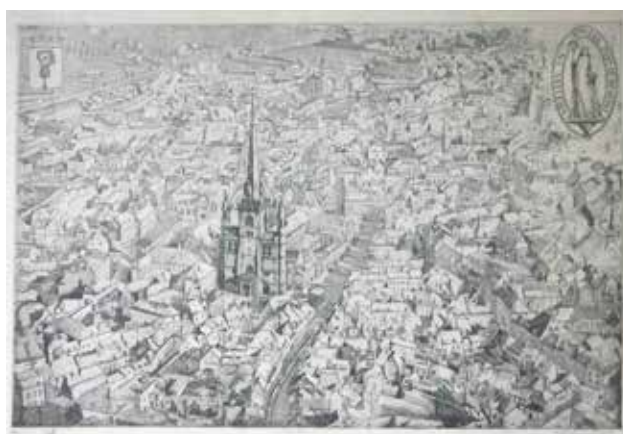
H. Quittelier, Panorama de Nivelles vers 1925, eau-forte, 1943. Coll. SANiv.

■ Grégory LECLERCQ , Echevin en charge du Musée communal