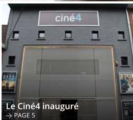
Le Ciné4 inauguré → PAGE 5