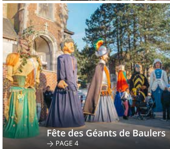
Fête des Géants de Baulers → PAGE 4