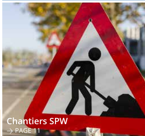
Chantiers SPW → PAGE 11

Renouvellement du permis de conduire → PAGE 11