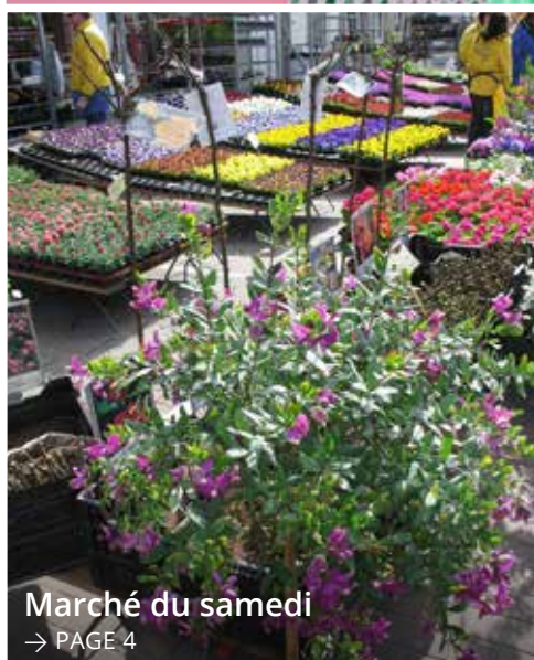
Marché du samedi → PAGE 4