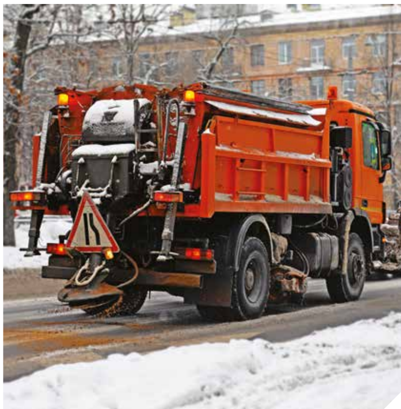
■ Pascal RIGOT, Echevin des Travaux

Si la neige est abondante, des bandes de dégagement sont tracées sur la Grand-Place pour faciliter le cheminement piéton.