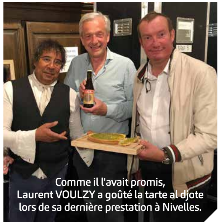
Comme il l'avait promis, Laurent VOULZY a goûté la tarte al djote lors de sa dernière prestation à Nivelles.

Une initiative de la Section belge francophone de l'IIBBY, en collaboration avec la Bibliothèque publique locale de Nivelles.