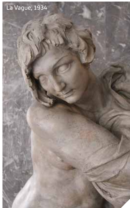
La Vague, 1934

Le projet s'accompagne d'une mise en valeur des sculptures dans le but de sensibiliser le public. Les œuvres ont été placées sur des socles réalisés sur mesure par les menuisiers du service Travaux, et seront prochainement accompagnées d'une plaquette explicative. Espérons qu'ainsi, elles seront davantage respectées et appréciées à leur juste valeur.